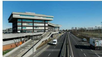
L'ex Alfa Romeo

Publicato il 3 agosto 2018 Ultimo aggiornamento: 3 agosto 2018 ore 07:22